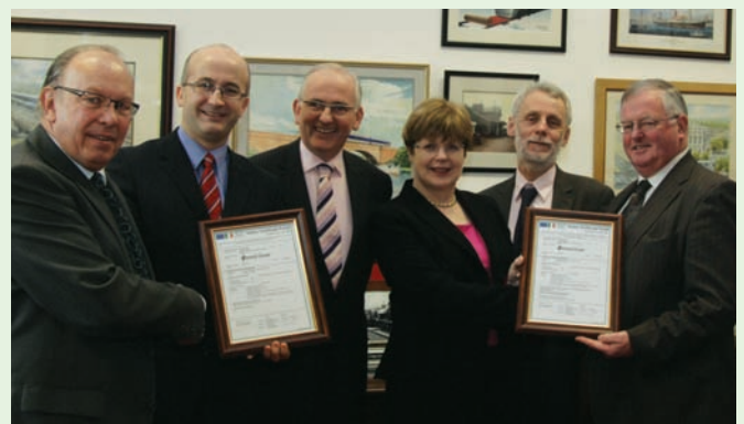
Presentation of Safety Certificate to IÉ 31st January 2011

Bhí ceithre dhroichead agus stáisiún nua i measc na ngnéithe den bhonneagar a ceadáíodh ar Líonra IÉ i rith 2011. Ar Líonra LUAS, osclaíodh Líne A1 idir Belgard agus Teach Sagard do thrácht paisinéirí an 2ú Iúil. San áireamh leis na ngnéithe den Rothstoc a ceadáíodh d'IÉ, bhí obair leanúnach ar an bpróiseas céimnitheach le meaisíní-ar-na-rianta a cheadú, chomh maith le hordú breise le haghaidh Carr Iarnróid Idirchathrach, agus uasghrádú ar Veain Gineadóra Mk III. Ceadáíodh Feithicil Ghlantacháin Bóthair-Iarnróid LUAS go rachfaí ar aghaidh le Dearadh Mionsonraithe a dhéanamh ina leith. Ceadáíodh na nithe sin ar fad faoin Acht um Shábháilteacht Iarnróid 2005. Tá liosta iomlán de thionscadail le fáil in Aguisín D.