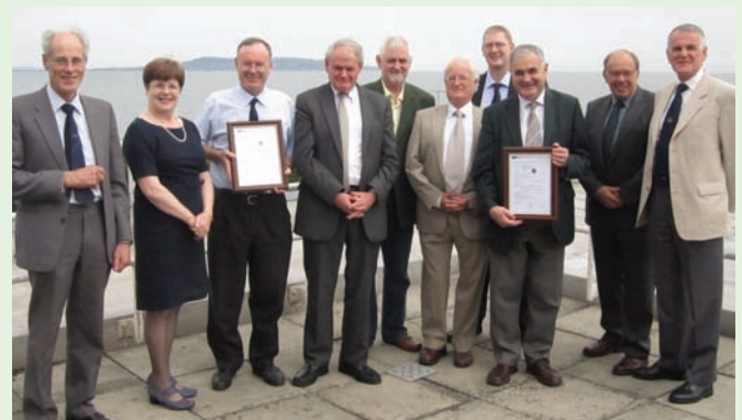
Presentation of Safety Certificate to RPSI 1st July 2011

Trasuíodh an Treoir maidir le hIdir-Inoibritheacht 2008/57/CE i nDlí na hÉireann i mí Lúnasa. Dá bharr sin, tugadh éifeacht don phróiseas Eorpach maidir le fochórais iarnróid a údarú le cur i mbun seirbhíse. Tá an CSI ag tabhairt a gcuid treoirínte cothrom le dáta faoi láthair go léireofar próiseas "An Údaraithe le Cur i mBun Seirbhíse" iontu. Beidh an t uasghrádú ar Stáisiún na bPiarsach ar an chéad tionscadal a cheadófar faoin réimeas nua.